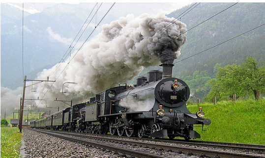
Mit Volldampf in die nächsten Jahre!

glieder an den runden Tisch, um über die Zukunft der Supporter-Vereinigung, die mittlerweile einen Bestand von 80 Mitgliedern aufweist, zu beraten. An der Herbstversammlung der Supporter-Vereinigung vom 28. September 2018, im Ristorante Mediterraneo in Steinhausen, wurde dann das Resultat dieser Gespräche den anwesenden Mitgliedern präsentiert. Die Bestimmungen (Gründungsurkunde vom 28. September 1982) sollen in einigen Punkten der heutigen Zeit angepasst werden.